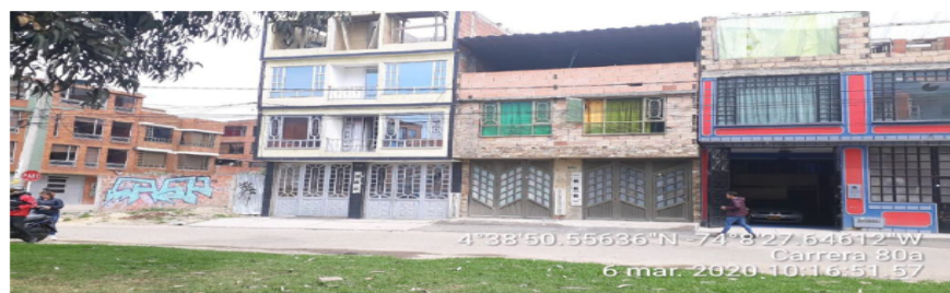
Fotografía No. 1. Predio Edificio en construcción, PEDH Techo.