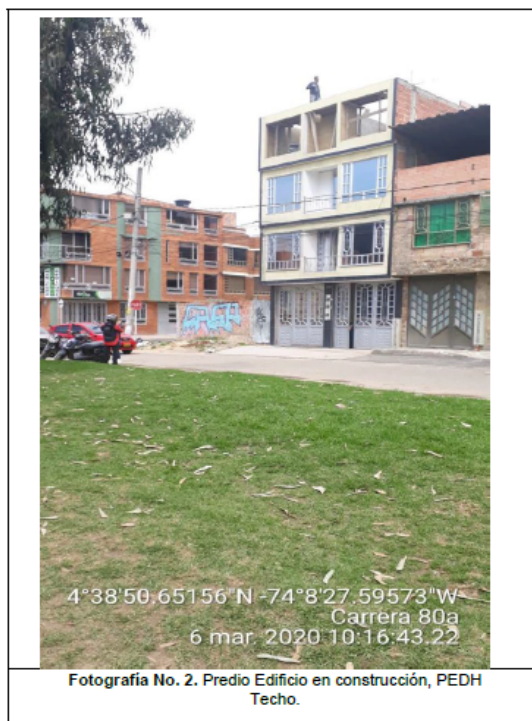
Fotografía No. 2. Predio Edificio en construcción, PEDH Techo.